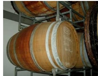
ロマネ・コンティの樽↑

多くは収穫量を抑えたヴィエイユ・ヴィーニュ（樹齢の高い木＝時間をかけて地中深くに伸びた根が土中の様々な養分を吸収することにより、複雑で深い味わいとなる。）から収穫された実をポテンシャルに合わせて4～5週間の浸漬させたり、コラージュフィルターの使用を一切なしで造る他、NOWAT（電力を使わず造る＝ワインに振動を与えない）など、細心の注意をはらったこだわりのワイン。