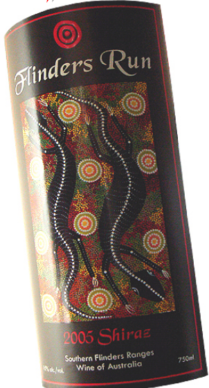
ラベル: アボリジニ(オーストラリア先住民族)・アート goanna ゴアナ(オーストラリアン・オオカガ)

Gulf)の海洋性気候の影響と、セント・ヴィンセント湾(Gulf of St Vincent)からの南風の影響を受けるためです。灌漑用水は地下水でまかなわれています。