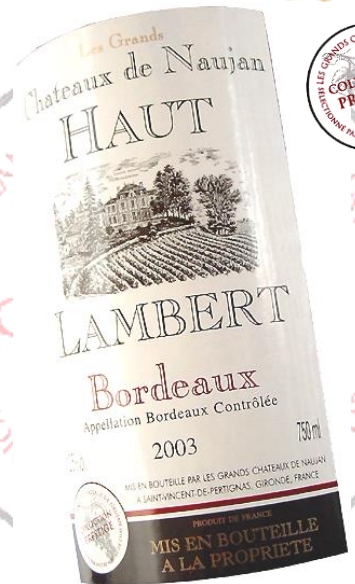
シャトー・デ・ノージャン ルージュ 赤 750ml/12本入 バーコード: 3700203020078