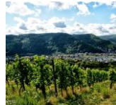
トラベン・トラバッハ村の急斜面にあるウルツガルテン畑

(ラングート社所有のエステート) 葡萄園所有の5代に渡る、由緒ある醸造所でワインの製造から瓶詰めまでを歴史ある丸天井のセラーで行なっています。