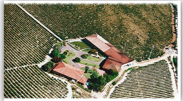
ボデガス アメゾーラ デラ モラ

畑はフランスのシャトーの影響を受けたスタイル。 自社畑 60 ヘクタール。ごろごろとした石で覆われ、 カルシウムを含む