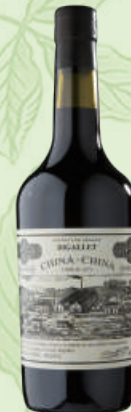
BIGALLET CHINA-CHINA ビガレ・シナシナ 700ml 40% 3336770000535